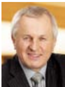
Dr. Erwin Pröll Landeshauptmann von NÖ

„Wir wollen mit dieser Ausstellung die Menschen aus OÖ und NÖ noch näher zusammenbringen, gerade auch um die zukünftige wirtschaftliche Entwicklung in dieser Region zu fördern.“