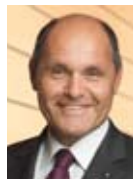
Mag. Wolfgang Sobotka, LH-Stellvertreter von NÖ

„Die Auseinandersetzung mit der Donau im Spannungsfeld zwischen Gefahren und Chancen macht diese Ausstellung zur Plattform und zum Impuls für die Region und die Menschen.“