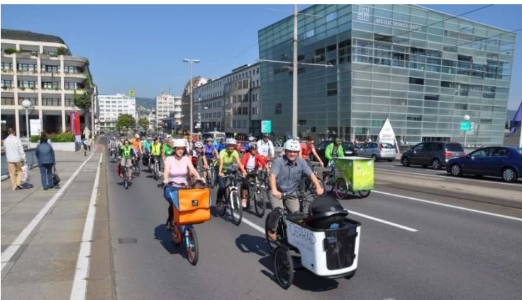
Eindrücke von der Linzer Rad-Parade

Aktuelle Informationen wie Treffpunkte der Sternradfahrt und das Programm der Rad-Parade sind auf www.radlobby.at/sternradln zu finden.